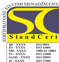
Slika 1 - Znak sertifikacije

Kada sertifikovana organizacija ima više poslovnica (zasebne organizacione jedinice na različitim lokacijama) ili sertifikati pokrivaju samo deo sistema menadžmenta koji je ograničen na sektor (npr. proizvodni pogon, služba i sl.) ili geografsku lokaciju, koja je deo u okviru organizacije, Znak se može koristiti samo za oblast koja je obuhvaćena predmetom i područjem sertifikacije. U dokumentima koji su zajednički za sve poslovne jedinice, može se koristiti Znak pod uslovom da su ispod njega navedene poslovne jedinice na koje se znak sertifikacije odnosi. Ne sme se stvoriti utisak da je cela organizacija sertifikovana.